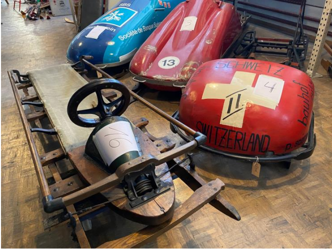
Schlitten aus einem Dreivierteljahrhundert Bobsport.