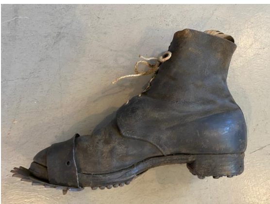
Mit solchen Schuhen wurde vor rund 100 Jahren Skeleton gefahren (und gesteuert).