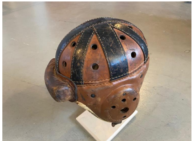
Ein Lederhelm aus Vorkriegszeiten.